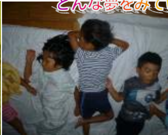
どんな夢をみているのかな~(☆ ☆)