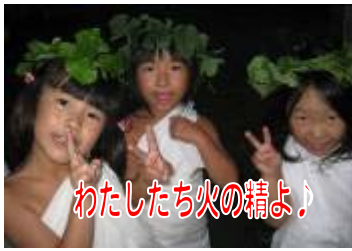
わたしたち火の精よ!