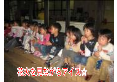
花火を見ながらアイス☆