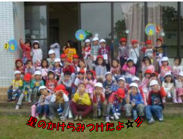
星のかけらみつけたよ☆

帰りにひのレンジャーから、認定証をもらって2日間のお泊まり保育終了(^_^)お泊まり保育を経験しぐんと成長が感じられる子ども達。おうちの人と離れてお友達と一緒に、身支度やごはんの片付け、お風呂、みんなで寝て起きて...本当によくがんばりました!! 応援して下さったおうちの方々、昨日は眠れない夜を過ごされた方も!? 子ども達はまた一つ大きくなって帰ってきました。みなさん、本当にありがとうございました! お引越しするお友達とも楽しい思い出ができました。これからもずっと友達だよ