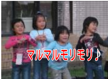
マルマルモリモリ♪