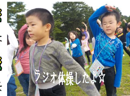
ラジオ体操したよ☆

朝の気持ちのよい風の中、朝の集いに参加して、ラジオ体操をしました。朝ごはんの前に5つめのシールもゲット♪いよいよえぼしへやまのぼり!! 佐世保の町を見下ろせる頂上はとっても気持ちいい♪ヤッタークリア!!