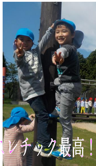
アスレチック最高！！