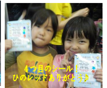
4つ目のシール! ひのレッドありがとう♪