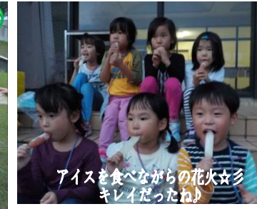
アイスを食べながらの花火☆キレイだったね!