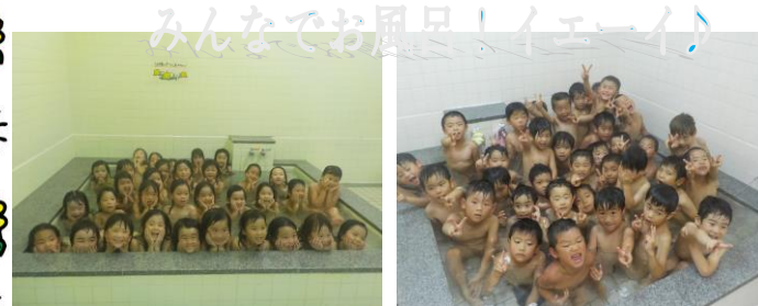
みんなでお風呂♪イェーイ!