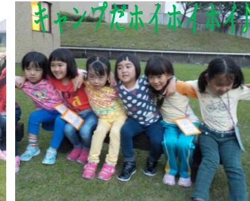
キャンプだホイホイホイ!