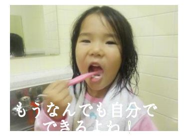
もうなんでも自分でできるよわ!

みんなでお風呂☆「お風呂気持ち〜」とみんな笑顔(*^_^*) 大きな風呂は温泉みたいで楽しかったね。歯を磨いて、おやすみなさ〜い。明日は山登り! みんなで楽しむぞー!