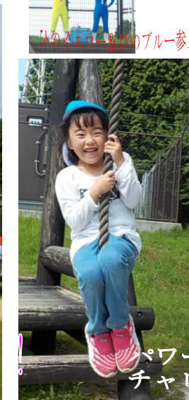
みんなのブルー参上