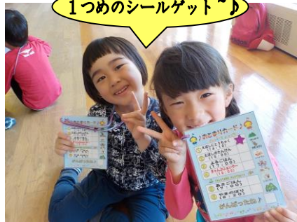
1つめのシールゲット♪