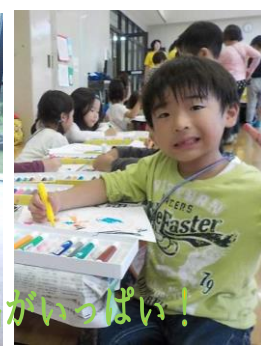
楽しい思い出がいっぱい!

思い出製作では、お泊り保育のおもいでカレンダーを作りました。楽しかった事や楽しみなことを絵に描いて、見せ合いっこしていましたよ☆自分だけのすてきなカレンダーができました!!おうちに帰ってからも、飾って使ってね!!