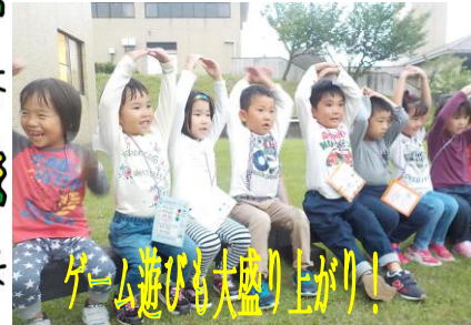
ゲーム遊びも大盛り上がり!